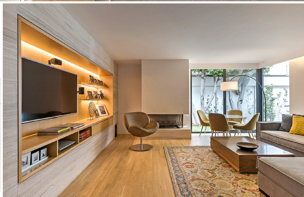
■ El family room combina muebles con diferentes ergonomías.

El trazo de la casa es un conjunto de volúmenes interceptados, cada uno definido por una forma y función distinta. El cuerpo más cercano a la calle aloja la sala, mientras que el comedor es más alto y se retrae un poco hacia atrás, al tiempo que se conecta con la cocina.