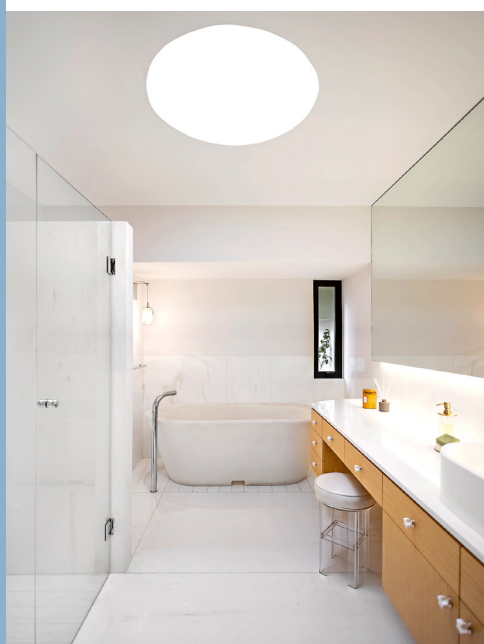
■ La pureza del baño culmina en el fondo con una moderna tina.