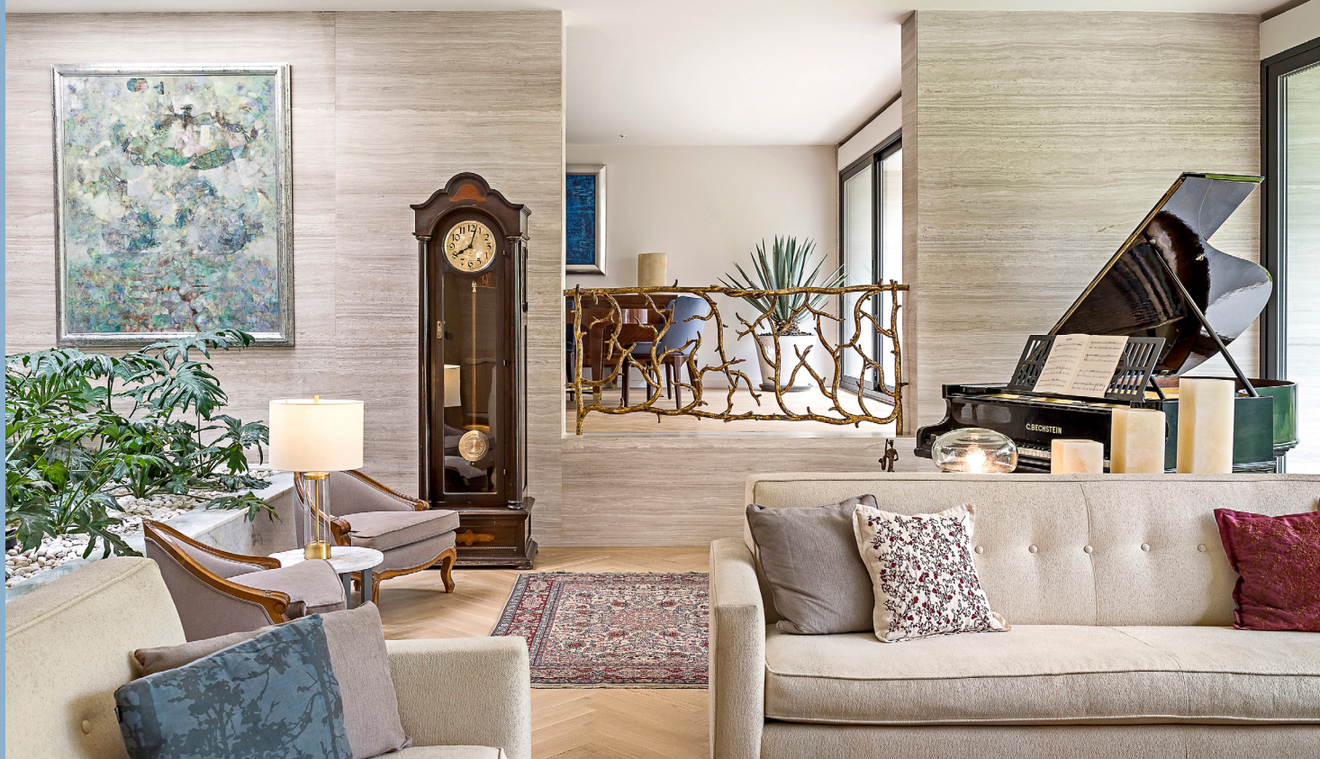
■ El piano de cola en color negro figura también como una propuesta de diseño.