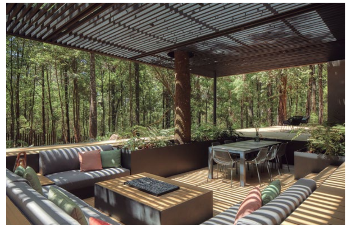
La iluminación tiene un gran significado, ya que juega el papel protagonista. Ésta se realizó a través de arbotantes redondos y lámparas suspendidas cilíndricas de recinto negro, diseñadas exclusivamente para este proyecto.