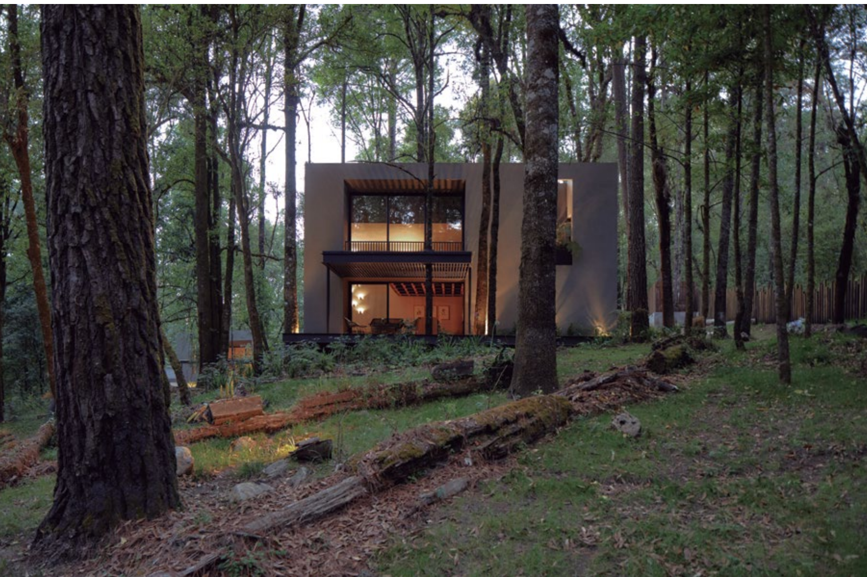
La propuesta de diseño arquitectónico busca una atmósfera serena que dialogue y responda al entorno.

RANCHO SAN SIMÓN muestra la presencia esencial de la naturaleza al encontrarse en medio de un bosque de Valle de Bravo sobre un terreno de 5,000 m 2 . Este majestuoso recinto se eleva en cinco volúmenes de diferente escala, sumando aproximadamente 900 m 2 .